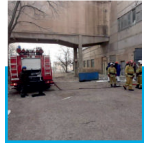
Өртке қарсы жаттығу