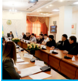
Встреча первого руководителя с коллективом