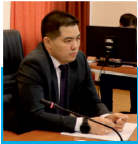
Кәсіпорында жаңа басшы