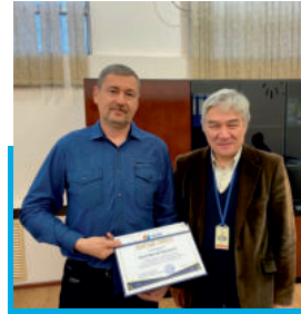
Лучший работник года