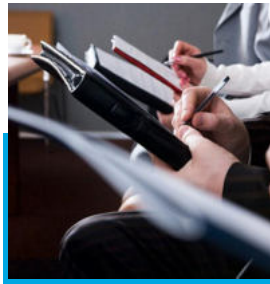
Комбинатта қоғамдық кенес құрылды