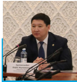
Встреча с прокурором города