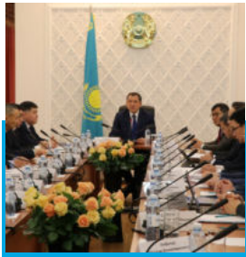
Басты тақырып: жабдыктарды жаңарту