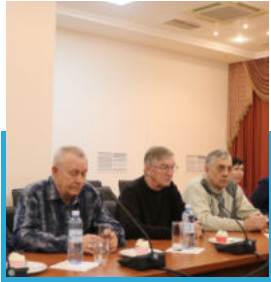
БН-350 РҚ ардагерлері марапатталды