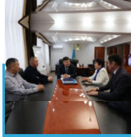
Құрметпен құрметті демалысқа