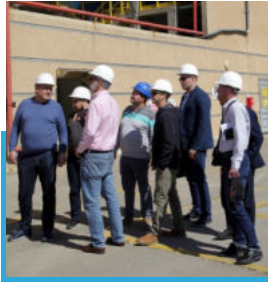
Рабочий визит в Израиль